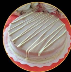
Tarta de Chocolate y Caramelo