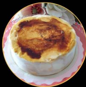
Tarta de Yema crujiente

Helados La Perla te acompaña en tus celebraciones en casa El sabor de la ilusión