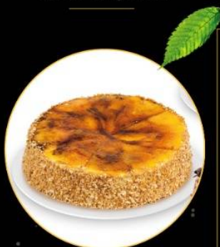
Tarta de Whisky artesana