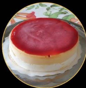
Tarta de Yogur y Mango tropical